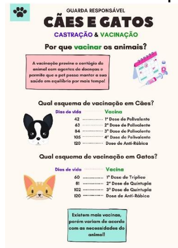
Figura 4 – Material utilizado nas palestras