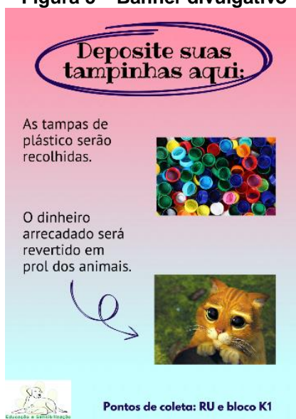
Figura 5 – Banner divulgativo

Além das atividades citadas anteriormente, houve coleta de tampinhas plásticas para reciclagem, ver Figura 5, e organização de duas edições, ver Figura 6 e Figura 7, do evento beneficente BREDOG (a primeira ocorrendo nos dias 11 e 12 de abril e a segunda ocorrendo nos dias 14, 15, 16 e 17 de agosto), brechó cujo qual aceitava doações, principalmente de peças de roupas, e onde estas peças eram vendidas, este evento contou com o voluntariado de alunos da UTFPR Campus Dois Vizinhos, como mostrado na divulgação da Figura 8, e todo dinheiro arrecadado pelas ações do projeto foi transferido em prol dos animais.