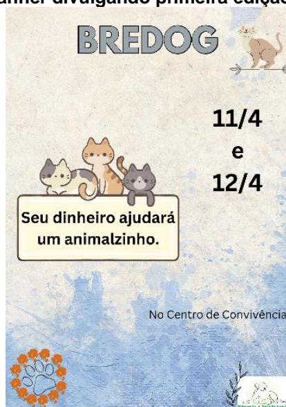
Figura 6 – Banner divulgando primeira edição do BREDOG