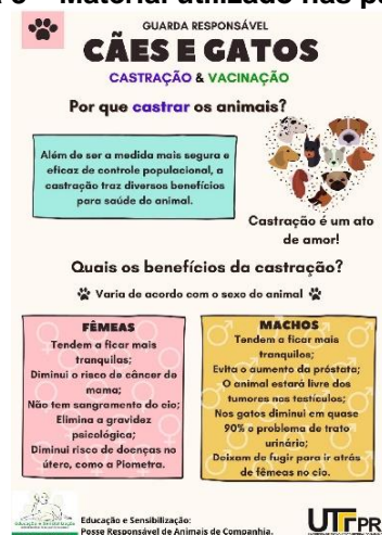
Figura 3 – Material utilizado nas palestras