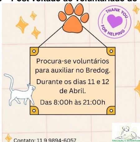
Figura 8 – Post voltado ao voluntariado do BREDOG