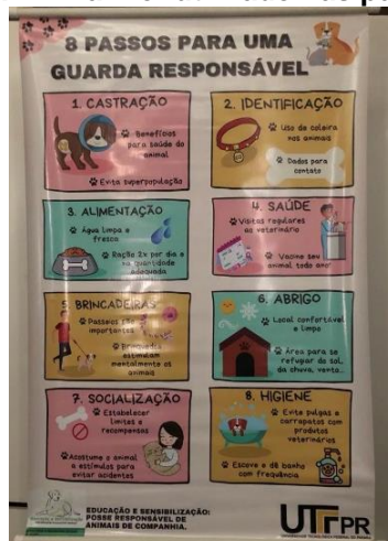
Figura 2 – Banner utilizado nas palestras