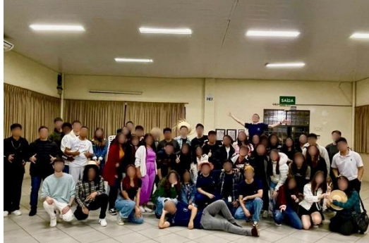
Figura 1 - Atividade de integração didática-social entre os estudantes e os membros do projeto.