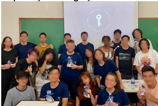
Figura 2 - Atividade de capacitação e integração social entre os voluntários do projeto